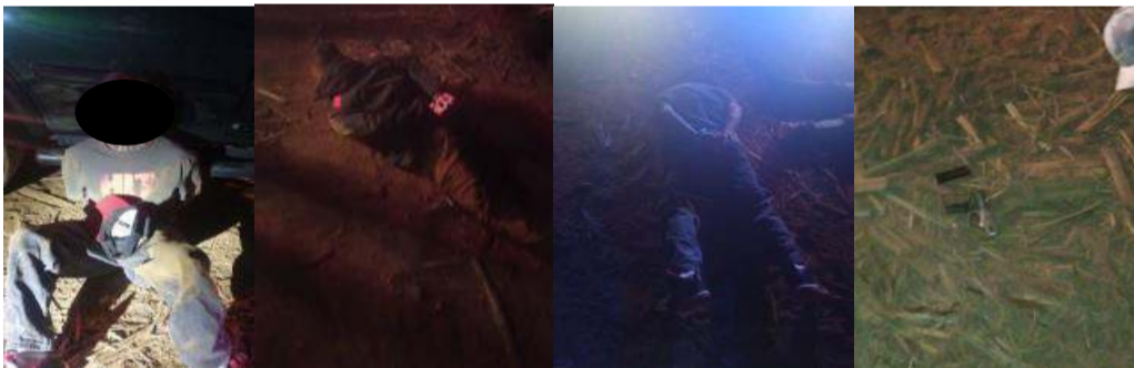
En Control vehicular en Carrillos bajo, por el ingenio, elementos hacen caso omiso a la señal de alto de los oficiales, en el seguimiento botan un arma y se detienen por Calle Las Latas.