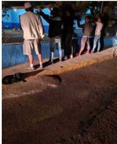
Abordajes Carrillos Alto, por la plaza