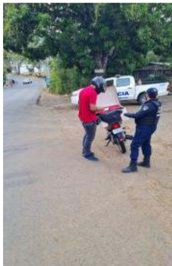
Control vehicular en Carrillos bajo, al frente del Ingenio

Fuerza Pública de Costa Rica Honor de Servicio