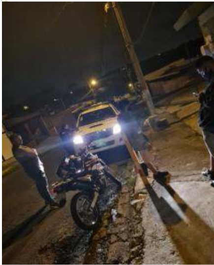
Abordajes Carrillos Bajo, Ramasal