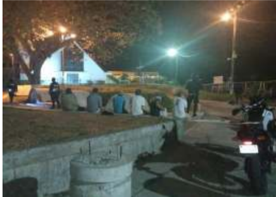
Abordajes Carrillos Alto, por la Iglesia en conjunto con el GAO