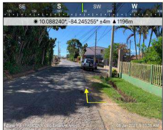
Fotografías 5 y 6. Franja en terreno natural donde se propone construcción de cordón y caño

Para atender esta situación, se propone: