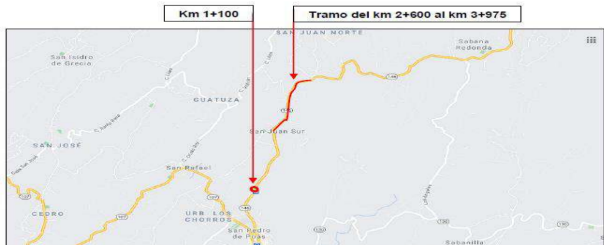
Imagen 1. Ubicación de los tramos que presentan problemas con el manejo de aguas pluviales.

36 En la siguiente imagen se precisan los puntos reportados con los problemas relacionados al manejo 37 de las aguas pluviales