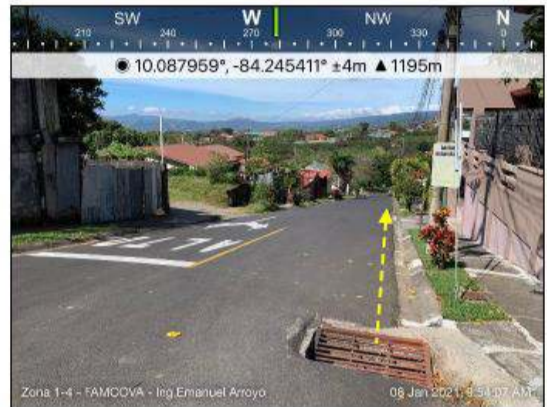
Fotografía 8. Tubería existente en calle cantonal

Además, en este mismo tramo (en la estación 1+150 LI), se debe revestir el espaldón; debido a que existe un escalamiento entre el borde de la calzada y el espaldón mayor a 0,30 m. Esto aparte provocar socavaciones a la estructura del pavimento, también representa un riesgo para los usuarios de la vía (fotografías 9 y 10)