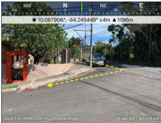
Fotografía 7. Línea propuesta para colocación de tubería