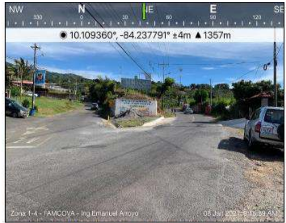
Fotografía 12. Estado actual, se deben reponer las barandas.

Por otra parte, la Dirección General de Ingeniería de Tránsito del MOPT es quien determina (mediante la elaboración de un estudio técnico), la necesidad de construcción de reductores de velocidad, señalización vial, puentes peatonales, barreras flexibles o rígidas, y demás temas de seguridad vial.