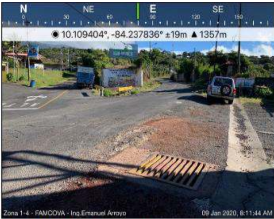
Fotografía 11. Barreras flexibles existentes en cruce San Juan Norte.