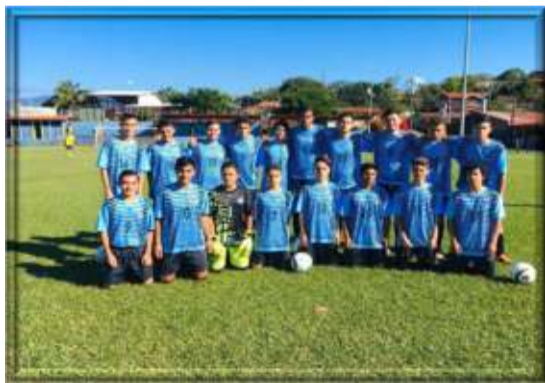
36 37 Sub 17