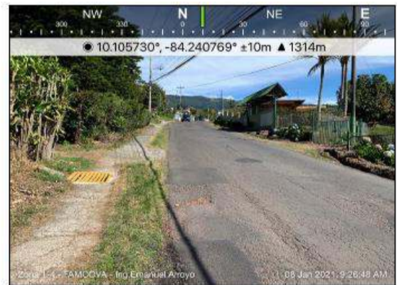
Fotografías 1 y 2. Acera peatonal en LI de la ruta

La franja en terreno natural que hay entre el borde de la calzada y el borde de la acera, es por donde escurren las aguas de forma deficiente (fotografías 3 y 4)