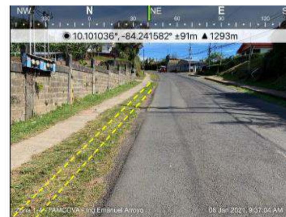
Fotografías 3 y 4. Franja en terreno natural donde se propone construcción de cordón y caño

Conociendo lo anterior, este Administrador Vial propone ejecutar (mediante la Licitación Pública 2014LN-000017-0CV00), la construcción de un cordón y caño a lo largo de esta franja (975 m), con el fin de recolectar y conducir las aguas pluviales hacia las cajas de registro existente por medio de la construcción de tragantes.