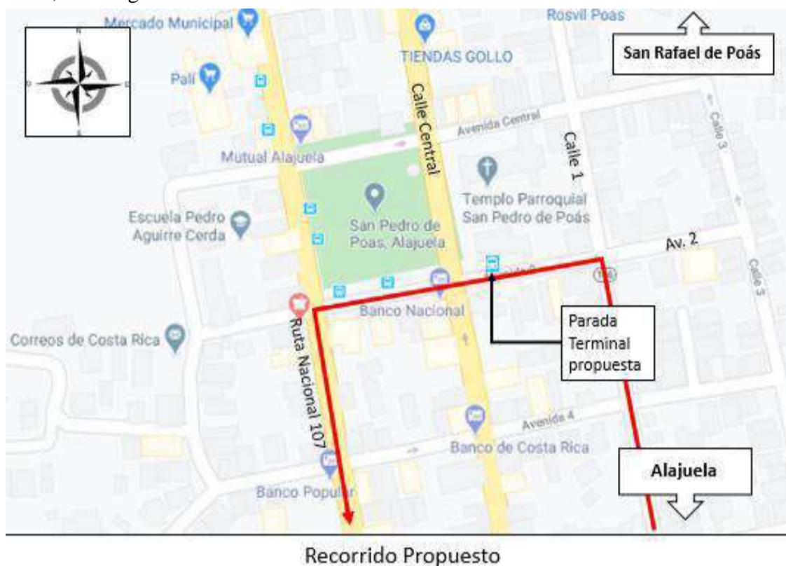
Figura 8. Modificación de recorrido propuesta Ruta N° 254