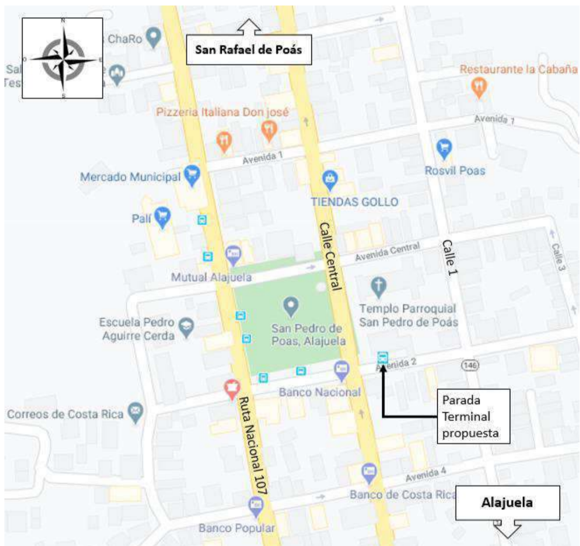
48 Figura 4. Croquis de la propuesta de parada terminal

10 En virtud de lo anterior, se ubicó un espacio que cuenta con los requerimientos mínimos y 11 que se encuentra cerca de la parada actual, para no afectar a los usuarios de los servicios. 12 La propuesta radica en ubicar la parada terminal de manera temporal sobre Avenida 2, entre 13 Calle Central y Calle 1, al costado Sur de la Iglesia de San Pedro de Poás. Dicha cuadra 14 cuenta con suficiente espacio para albergar la parada de autobús.