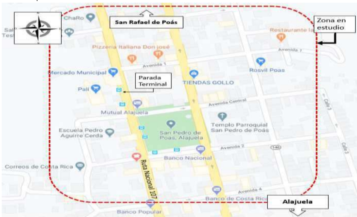
33 Figura 1. Croquis de la zona de estudio

29 En aras de atender la solicitud, se realiza una propuesta para la modificación de la parada terminal y 30 recorridos de la empresa Transportes Unidos Poaseños S.A. En la siguiente figura se puede observar 31 el croquis de la zona en estudio: