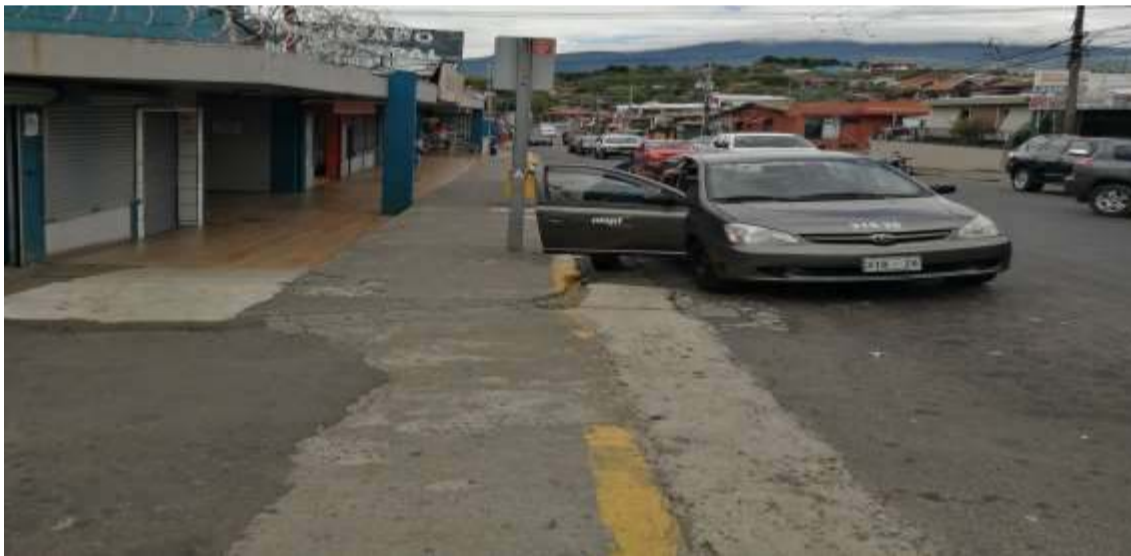
29 Figura 2. Fotografía #1 de la parada en estudio

8 9 En las siguientes figuras se muestran fotografías de la parada actual: