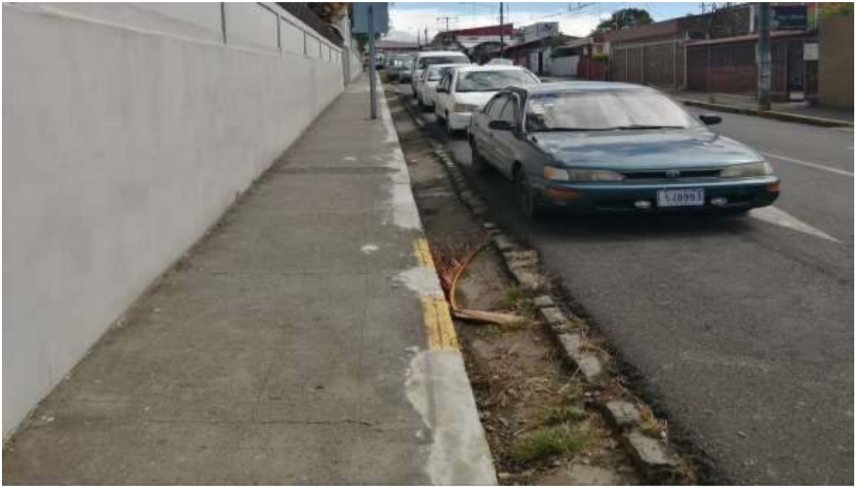
Figura 5. Fotografía de la parada propuesta

Adicionalmente, se deben variar los recorridos de la ruta que haría uso de esta nueva parada terminal, según se muestra en la siguiente figura: