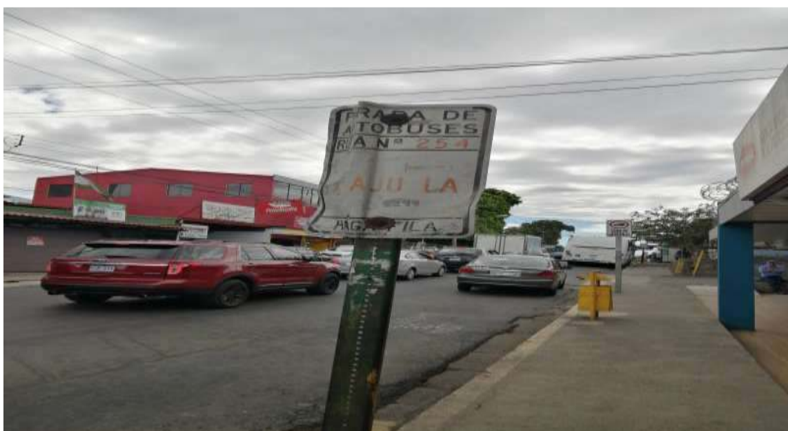
Figura 3. Fotografía #2 de la parada en estudio