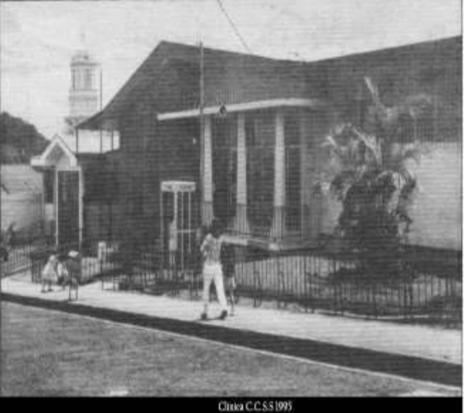
Iglesia C.C.S.S 1995