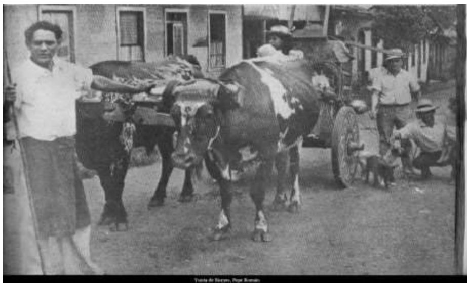
Tienda de Sacos, Poás, 1900.