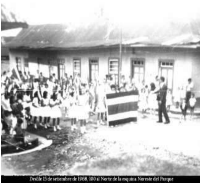
Desfile 15 de setiembre de 1968, 100 al Norte de la esquina Noreste del Parque