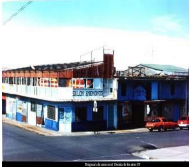
Digital a la casa central. Decada de los años 70