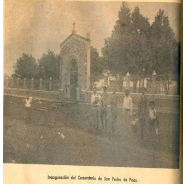
Inauguración del Cementerio de San Pedro de Poás.