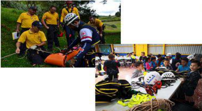
Cooperación y prácticas interinstitucionales