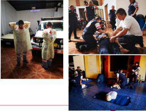
Prácticas y manejo de emergencias