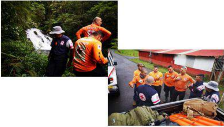
Búsqueda y rescate en montañas